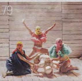
Mise en scène audacieuse, réflexions sur le genre... LE MARIAGE FORCÉ de Molière se fait apocalypse joyeuse.