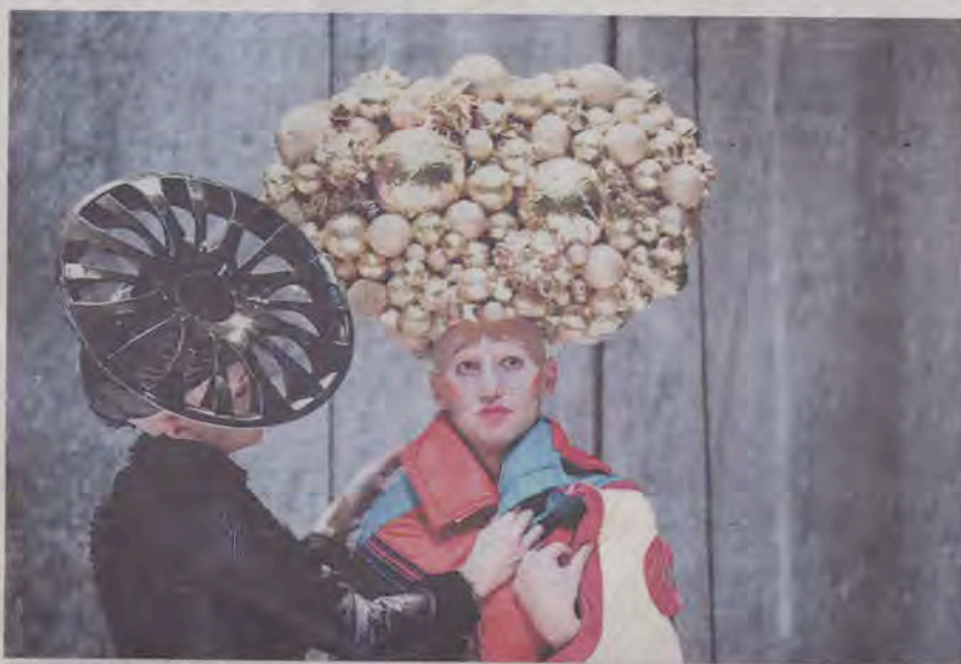
Perruques invraisemblables et costumes baroques de Christian Lacroix dans « 40° sous zéro ».