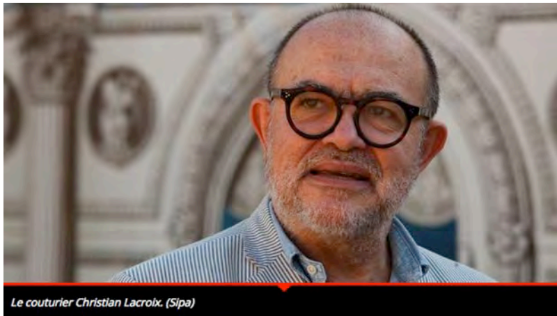
Le couturier Christian Lacroix.

Chaque production est différente en fonction des budgets mais ce n'est pas le plus important. A partir de fripes et de récupération, on fait des choses formidables et j'adore cela. Ce qui fait la vraie différence, c'est la personnalité du metteur en scène et de ses acteurs, l'ambiance des lieux et de la pièce elle-même. Pour 40° sous zéro , il y a des parkas et des vêtements vintage, mais aussi des costumes coupés à partir de maquettes et