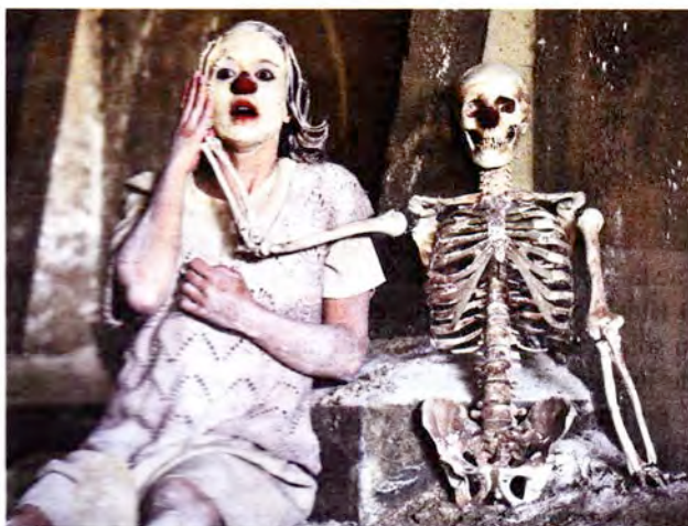
Une course au pouvoir, entre cirque, danse et commedia dell'arte.

bres du trio incongru n'en rejouent pas moins la sempiternelle course au pouvoir, passant en quelques répliques de l'anarchie à une surréaliste monarchie via une brève république. N'en finirons-nous donc jamais de ces luttes socio-politiques identiquement recommencées? Si le texte, rudimentaire, pêche par excès de minimalisme – l'acoustique du lieu n'aidant guère à sa compréhension – les trois bouffons au nez rouge sculptent superbement l'espace de leurs corps désarticulés, entre cirque, danse et commedia dell'arte. Du squelette aux bouteilles concassées, des vieux papiers aux vieux tonneaux, un monde mort exulte encore, même d'échec en échec. Et on en rit, la gorge serrée. Quand il faudrait pleurer.