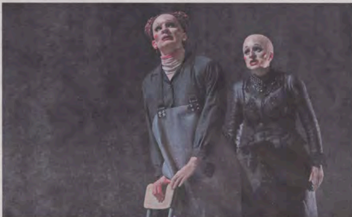
Le visage recouvert d'un masque fin, les comédiens ne sont pas beaux, mais inquiétants. Surnaturels. Et drôles.

Les costumes aussi peuvent être trompeurs. Celui du chien, par exemple, est fait de plusieurs dizaines de perruques jointes les unes aux autres. Pour les autres comédiens, c'est Christian Lacroix qui s'est mis à l'ouvrage. Puisant son inspiration dans un futur inconnu, au Japon, dans la mode doudounesque des pays montagneux, dans l'Angleterre élisabéthaine..., il a imaginé un vestiaire fantastique et fabuleux. Les comédiens étant affublés en plus, et selon les moments, de prothèses diverses, les faisant