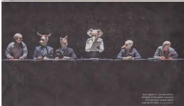
Avec Zypher Z., six comédiens affables d'étonnantes masques et costumes, se partagent près de 40 rôles.